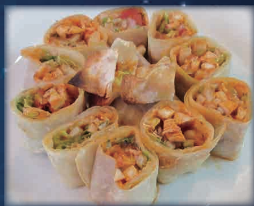
メキシカンタコス 900円