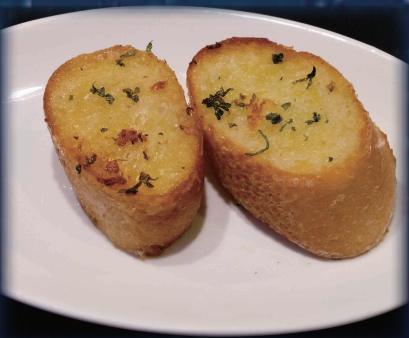
ガーリックトースト