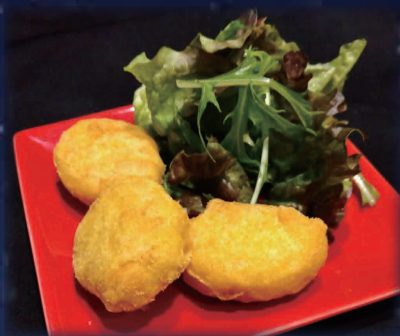
シャークナゲット (気仙沼産サメ使用)