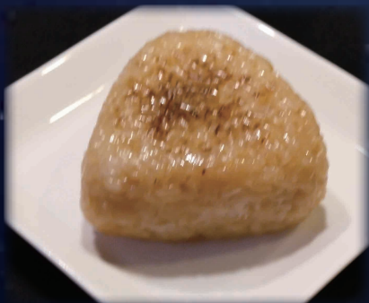
天かす入り 焼きおにぎり