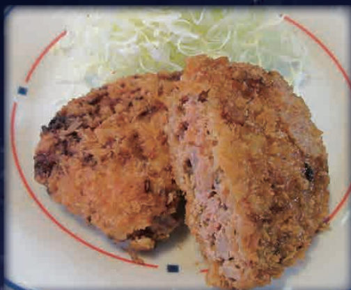
ビール園自慢のメンチカツ 630円