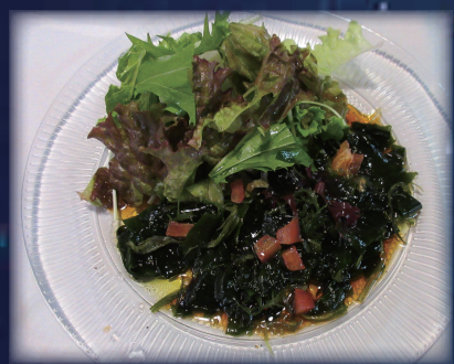
わかめカルパッチョ (宮城県南三陸町)