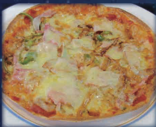
トルティーヤピザ 900円