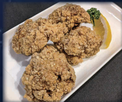
みんな大好き♪鶏から揚げ