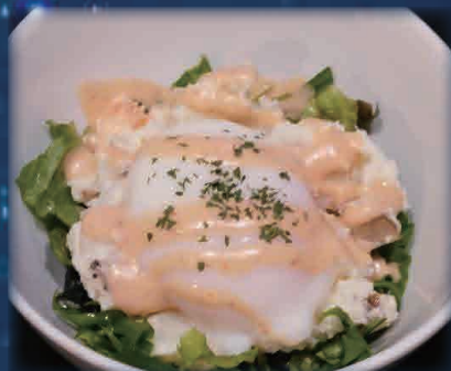
麦酒園のポテトサラダ