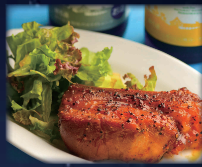
ビール園のスペアリブ