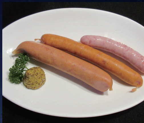
特選ソーセージ盛り合わせ 630円