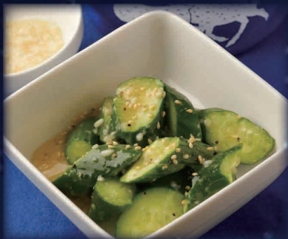
きゅうり塩こうじ和え