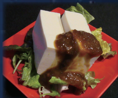
九戸村産辛みそやっこ